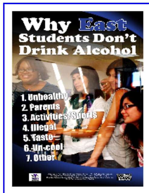
Muestra de la campaña de pósters en la escuela Maine East